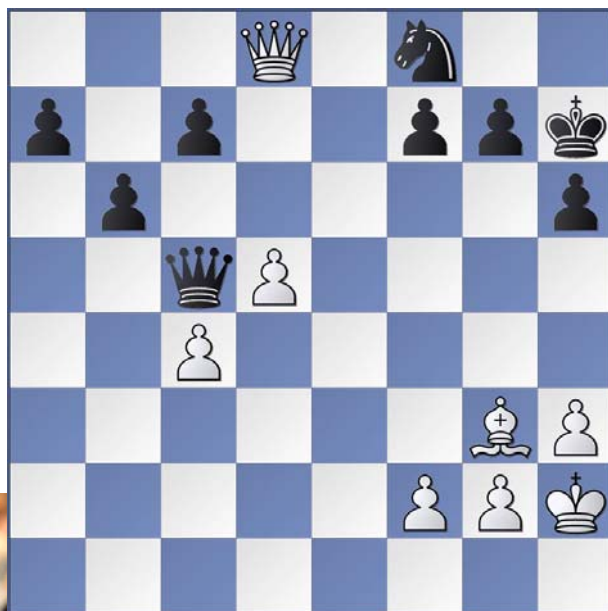
Anand, V - Shirov, A Mónaco 2005