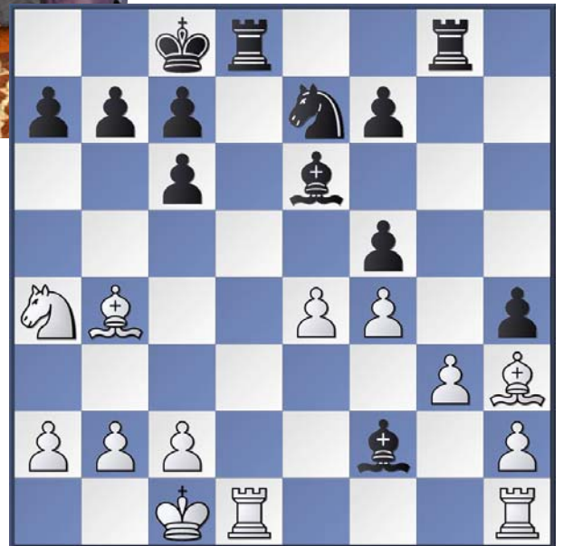
Anand,V - Shirov,A Linares 1997