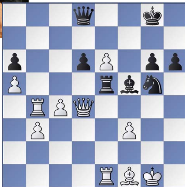
Anand, V - Shirov, A Wijk aan Zee 2010