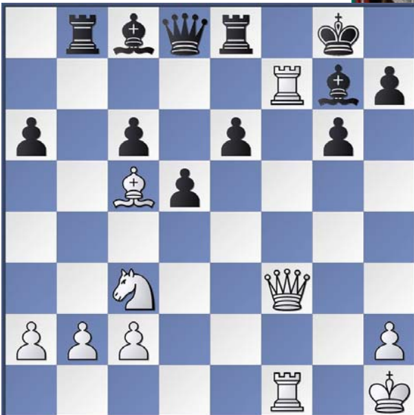
Shirov,A – Anand,V, Buenos Aires 1994