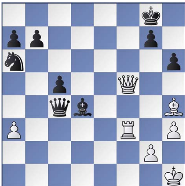
Anand, V - Shirov, A Moscú 2001