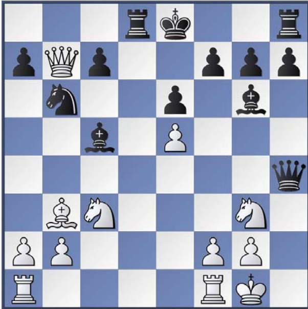
Shirov,A – Anand,V, Dortmund 1992