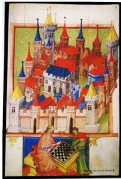
Jacobo de Cessolis

Con la intención de recuperar el sentido cultural del Ajedrez, A-Z, y dado el reducido espacio de la Sala Musas del Museo, hemos proyectado la esencial muestra: 32 libros de los fondos de la BNE, tal las piezas en el tablero. La exposición está estructurada en cuatro secciones: 1. Hitos de la Historia del Ajedrez. 2. Libros de Ajedrez. 3. Espiritualidad ( Libros y fragmentos de Ajedrez a lo Divino ) 4. Grandes autores de nuestra Lengua ( La infinita metáfora del Juego ).